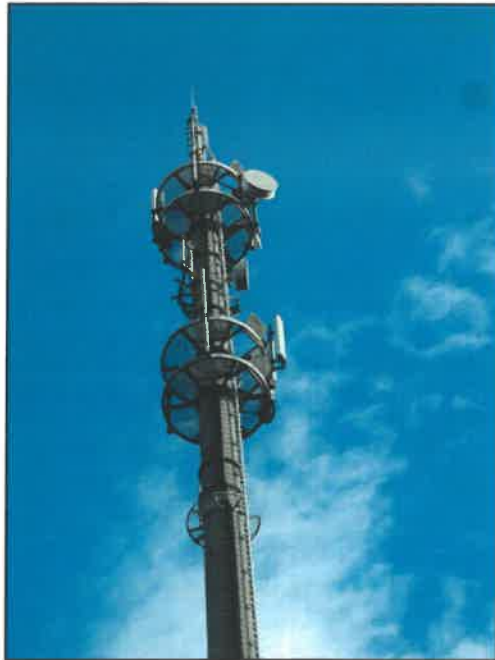
Rys. 3 Widok badanego obiektu