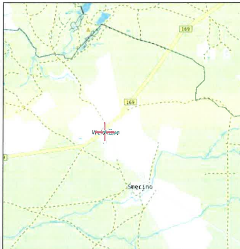
Rys. 1 Lokalizacja badanego obiektu