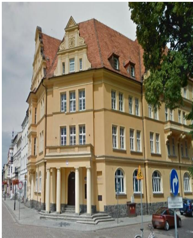
Budynek Starostwa Powiatowego w Białogardzie

Ponadto: Powiatowy Rzecznik Konsumentów, Inspektor Ochrony Danych, Biuro ds. Kontroli oraz Punkt nieodpłatnej pomocy prawnej, Zespół ds. Orzekania Niepełnosprawności.