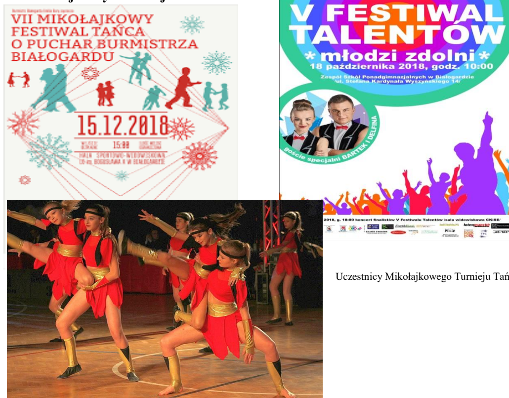
Uczestnicy Mikołajkowego Turnieju Tańca