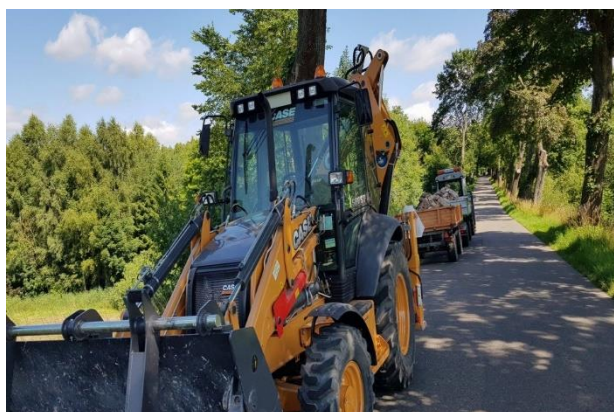
Remonter – maszyna do likwidacji ubytków nawierzchni i splekań

W roku 2018 ze środków powiatu zakupiono sprzęt: remonter za ponad 500 tys. zł oraz koparko-ładowarkę za kwotę 280 tys. zł.