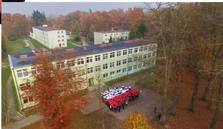
Budynek Zespołu Szkół Ponadgimnazjalnych w Tychowie

Szkoła prowadzi kształcenie w klasach mundurowych, które od lat cieszą się zainteresowaniem młodzieży z terenu Powiatu Białogardzkiego jak i z poza jego granic.