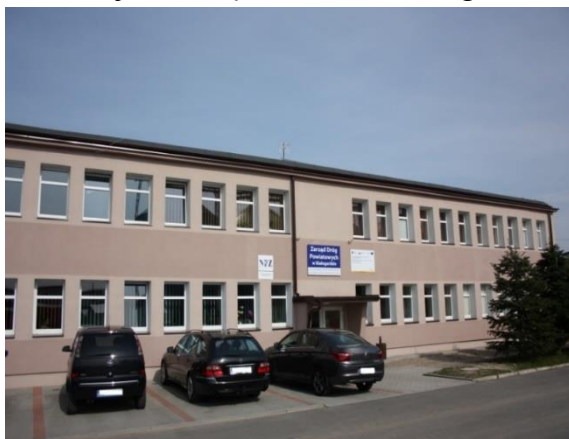
Budynek Zarządu Dróg Powiatowych w Białogardzie

Jest jednostką Powiatu Białogardzkiego, przy pomocy, której Zarząd Powiatu Białogardzkiego, jako zarządca dróg powiatowych, wykonuje zadania zarządu dróg powiatowych, wykonuje swoje zadania przy pomocy służby drogowej i obejmuje swym zakresem działanie na sieci dróg powiatowych na terenie Powiatu Białogardzkiego.