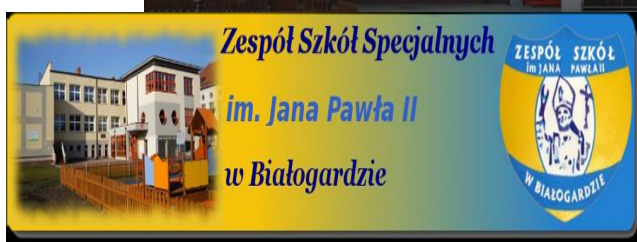
Budynek Zespołu Szkół Specjalnych w Białogardzie