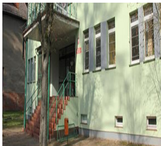
Siedziba Powiatowego Urzędu Pracy w Białogardzie

Powiatowy Urząd Pracy w Białogardzie jest jednostką organizacyjną powiatu. Urząd realizuje zadania samorządu powiatowego w zakresie polityki rynku pracy na podstawie ustawy z dnia 20 kwietnia 2004r. o promocji zatrudnienia i instytucjach rynku pracy (Dz. U. Nr 99, poz. 1001późn.zm). Przy realizacji zadań współpracuje z organizacjami pracodawców, pracodawcami, związkami zawodowymi i innymi instytucjami zajmującymi się problematyką bezrobocia.