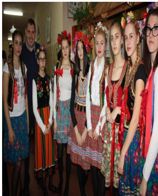
Uczniowie Zespołu Szkół Ponadgimnazjalnych w Białogardzie podczas prezentacji zdrowej żywności