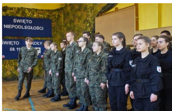
Pokaz uczniów ZSP w Tychowie podczas „Święta Szkoły”