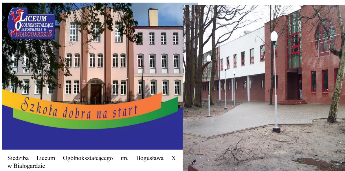
Siedziba Liceum Ogólnokształcącego im. Bogusława X w Białogardzie

Jest szkołą ponadgimnazjalną, która umożliwia zdobycie wiedzy i umiejętności niezbędnych do uzyskania świadectwa ukończenia liceum ogólnokształcącego oraz złożenia z wynikiem pozytywnym egzaminu maturalnego.