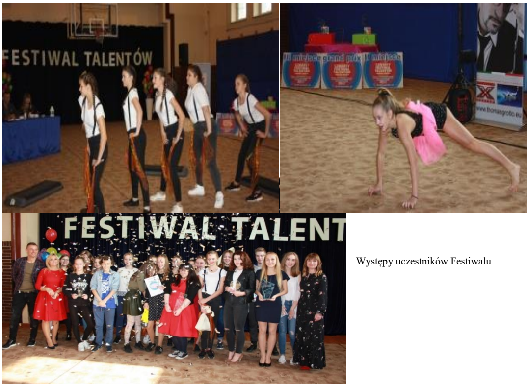
Występy uczestników Festiwalu