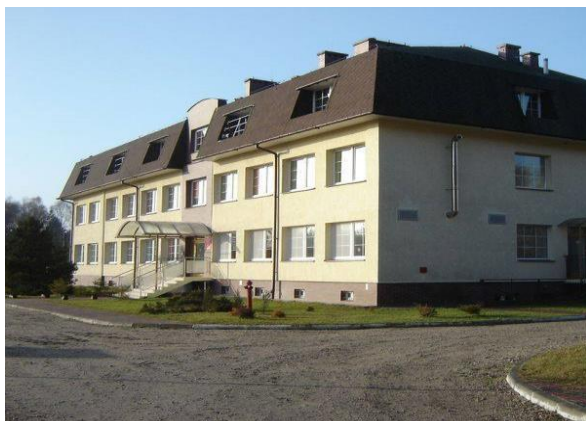
Budynek MOW w Podborsku

Jest to placówka resocjalizacyjna, przeznaczona dla chłopców w wieku do 18 roku życia z zaburzeniami w zachowaniu, niedostosowanych społecznie, zagrożonych uzależnieniem w stopniu utrudniającym im realizację zadań życiowych.