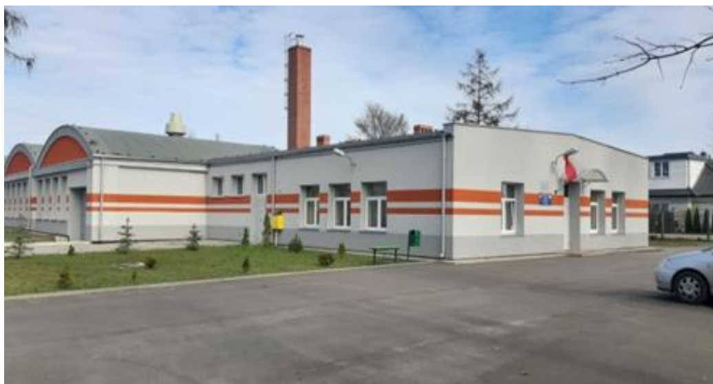
Siedziba Centrum Kształcenia Praktycznego oraz Internatu ZSP w Białogardzie po termomodernizacji

Szkoła posiada dodatkowo nowoczesne Centrum Kształcenia Praktycznego oraz Internat.