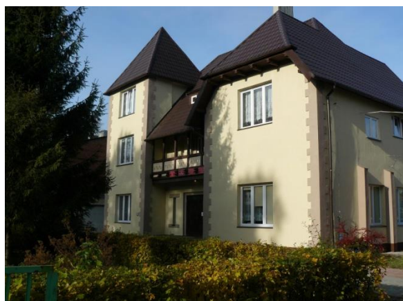
Siedziba Centrum Wspierania Rodziny „Dom pod Świerkiem” w Białogardzie

Głównym zadaniem placówki jest kompleksowa obsługa zadań Powiatu Białogardzkiego w zakresie całodobowej pieczy zastępczej, prowadzenie i realizowanie zadań rządowych w zakresie prowadzenia ośrodka wsparcia dla ofiar przemocy w rodzinie oraz w zakresie wsparcia rodziny poprzez prowadzenie placówki wsparcia dziennego o zasięgu ponadmiejscowym.