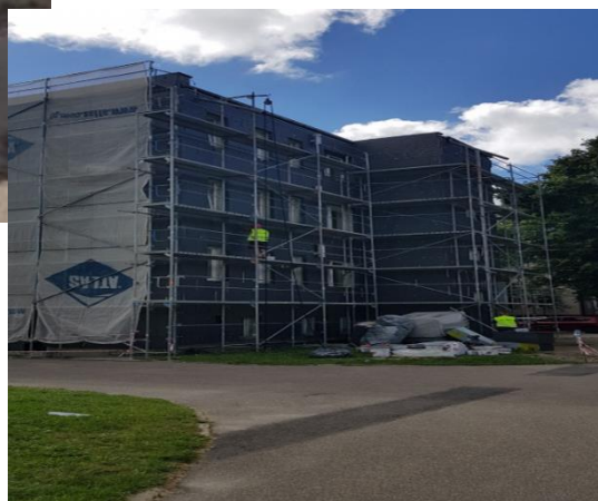
Termomodernizacja budynku Centrum Wspierania Rodziny