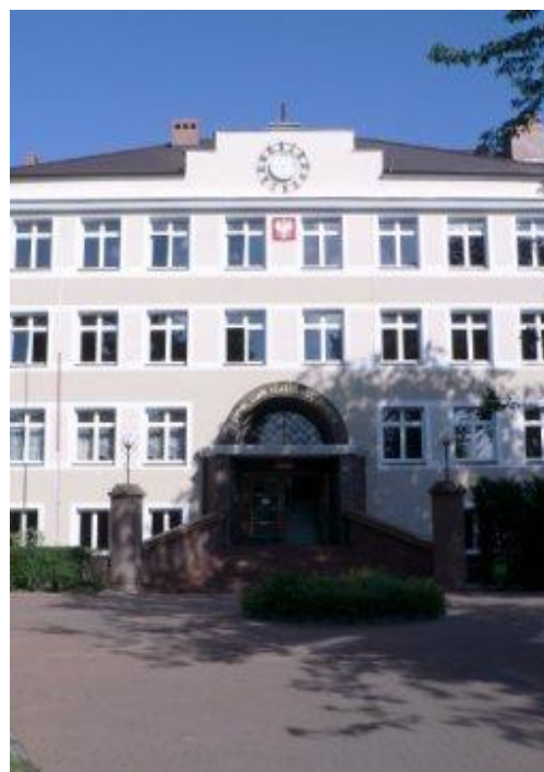
Budynek ZSP w Białogardzie

Szkoła posiada dodatkowo nowoczesne Centrum Kształcenia Praktycznego oraz Internat.