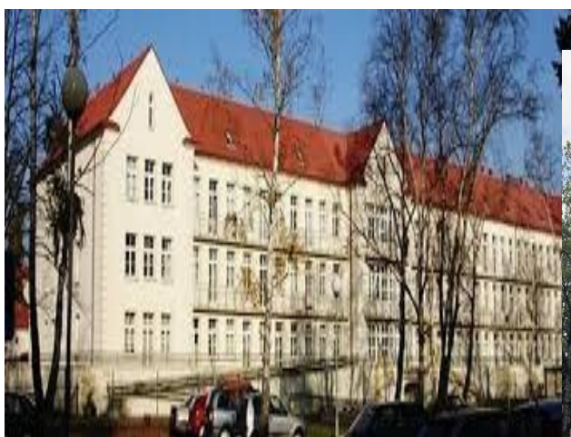
Budynki Szpitala Powiatowego w Białogardzie

W 2018 roku Szpital w Białogardzie udzielał świadczeń zdrowotnych w niżej oddziałach oraz poradniach wymienionych poniżej: