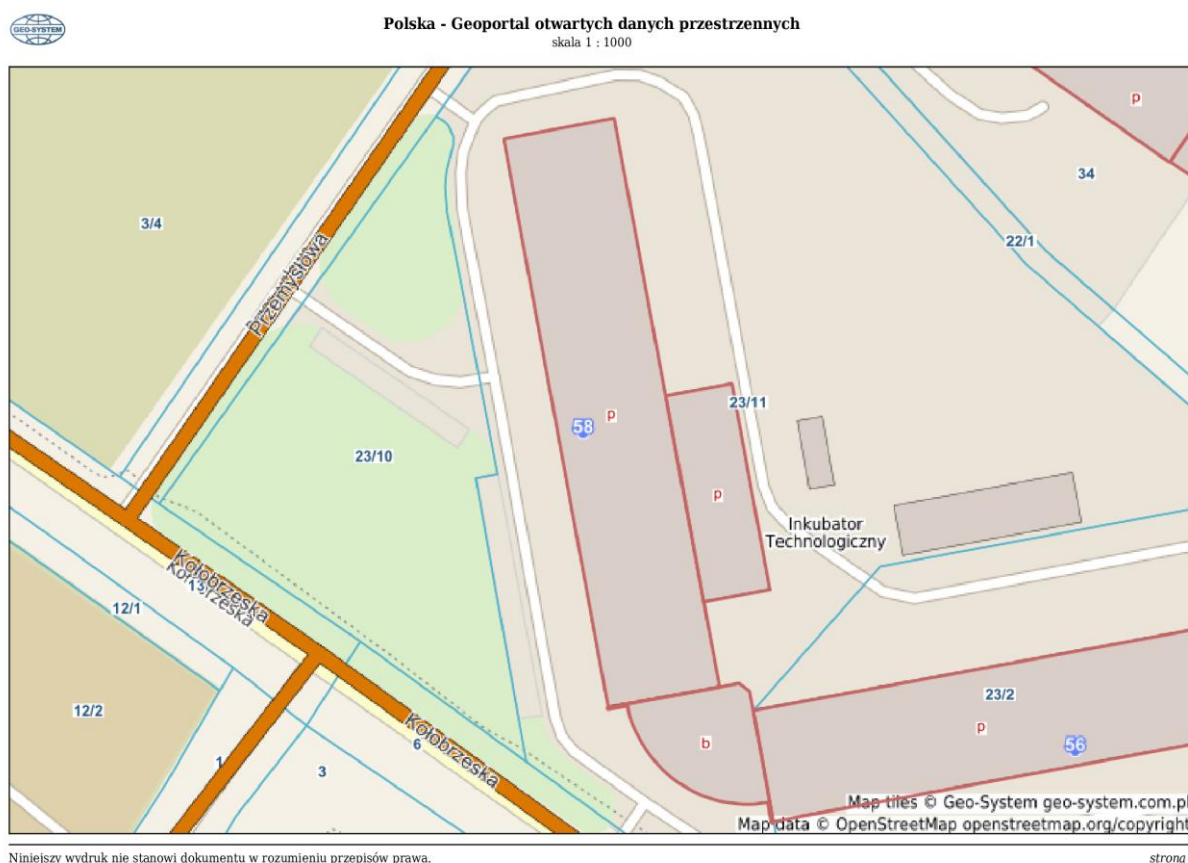
Widok działki nr 23/10 z geoportalu

Natomiast wzdłuż granicy przy ul. Przemysłowej, przebiega kabel energetyczny oraz w odl. ok. 10m – przewód gazowy. W północnej części działki przebiega odcinek kanalizacji deszczowej. Teren działki płaski.